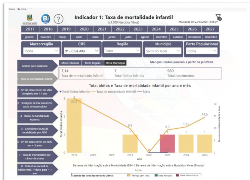
Fonte: 9ª Coordenadoria de Saúde / Cruz Alta /RS - 2025