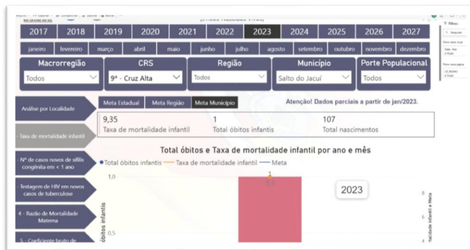
Figura 3 – Indicador de Mortalidade Infantil

O acesso a medicamentos básico e especializado, inclusive para populações indígenas, quilombolas rurais e urbanos pelo SUS básico com alto custo via Farmácia Básica.