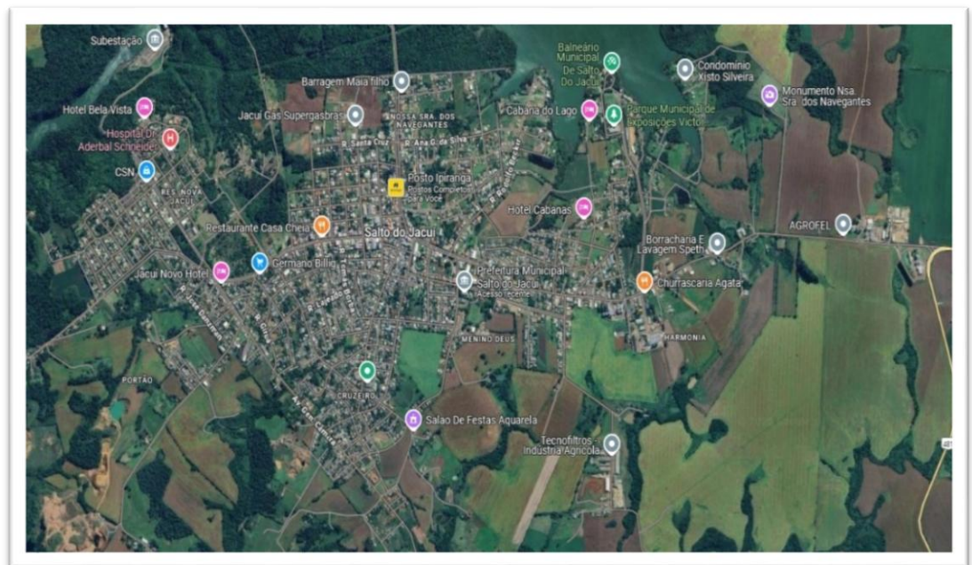
Figura 1 - Mapa de identificação do Município

Assim, ilustra-se as figuras abaixo com identificação geográfica, perfil populacional,